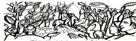
"Béni celui qui vient au nom du Seigneur!"